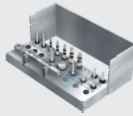
Компактный мини-набор 85 405₽