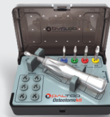
Полный набор остеотомов 37 905₽