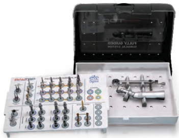
Хирургический набор для полного протокола (Komet, Германия)