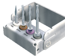
Набор пилотных сверл для хирургического шаблона