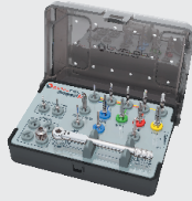
Компактный набор 123 405₽