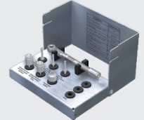
Ортопедический набор 53 200₽