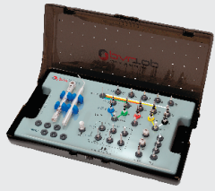
Премиум набор + стопперы 266 000₽

Изготавливаются на заводе Komet, Германия.