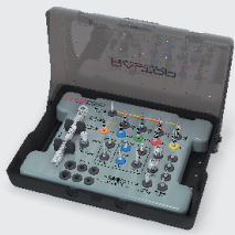
Стандартный набор 151 905₽